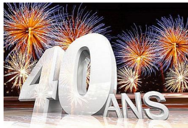
40 e anniversaire de fondation 1978-2018